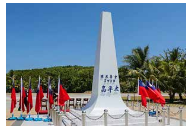
最大敗筆是將太平島判為礁

三、南海仲裁案還犯了程序上的致命錯誤。仲裁庭不是從法庭審判必須遵守的程序正義出發，而是未進入程序先預設政治立場，即要將中方所主張的「九段綫」全部推翻，為達到此目的，不惜違反法律最基本的公正原則，整部仲裁「文本」充斥著刻意為菲律賓辯護的語言偽術，明顯屬政治裁決而非法律裁決。其目的是要配合美國的重返亞太戰略，將中國的勢力排除出南海，把南海變成由美國掌握話語權的公海，最終是由美國主導訂立一個類