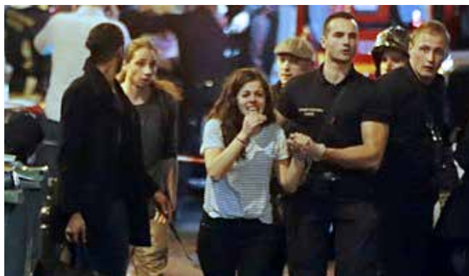
巴黎恐襲，生還者逃離現場

案犯）都是馬格里布移民二代，都是有某教某派背景的激進分子，當然他們本人的境遇都不會很好。今年在比利時、德國發生的多起恐怖活動無論大型還是獨狼，都與法國的特徵十分接近，都有移民和某教極端派的背景。總的趨勢是：花樣不斷翻新，越來越難於防範，直至完全無法防範。