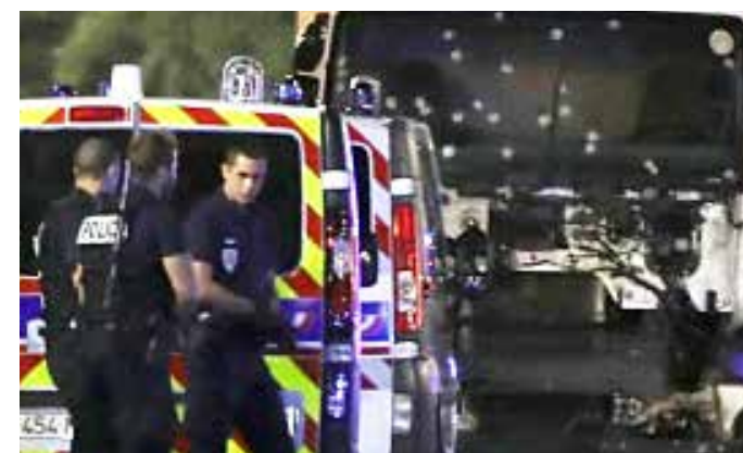
尼斯恐襲，兇嫌所駕貨車彈痕累累