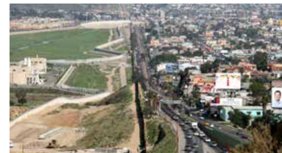
特朗普要在美國與墨西哥邊界建隔離牆

阿克頓研究所（Acton Institute）國際事務負責人托德·赫伊津哈（Todd Huizinga）對《超訊》說：「從911之後，國際恐怖主義對美國人一直都是衝擊。他們背後沒有任何一個國家的支持，只用很少的人，就可以製造巨大的災難，而且會有很大的影響。美國在很多方面作出了很多努力，對他們進行打擊，軍事上或者是財務上。這些恐怖組織的金錢鏈條、洗錢通