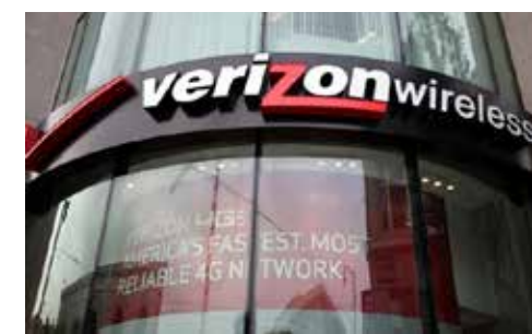
美國最大手機運營商 Verizon

舊的巨頭隕落，新的巨頭崛起。雅虎出售，使移動互聯網廣告市場進一步向 Google、Facebook 及 Verizon 幾個巨頭集中。不難想像，哪一天 Twitter 也可能失去獨立性，落入他人之手。