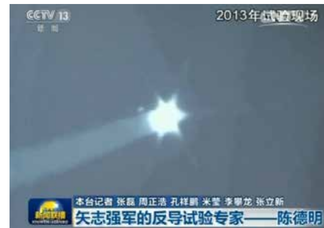
央視公布中國中段反導試驗畫面

韓國政府的決定和國民的反應，以及各黨派的戰略目的可以說正處在一個混亂期。東北亞國際格局與韓國的政治轉向有很密切的關係。大國之間的博弈與南北韓之間的矛盾，以及韓國國內的政治環境之間有一定的制約，又有密切合作的必要。將來在東北亞國際體系裏，今年的G20會議，以及中國共產黨在十月即將舉行的十八屆六中全會和年底的美國大選，還有2017年下半年中國共產黨召開的「十九大」與韓國將要舉行的總統選舉都將影響到東北亞各國之間的關係變化。這其中還涉及到朝鮮的核開發問題，以及中美關係和日本的國家「正常化」之路的影響。