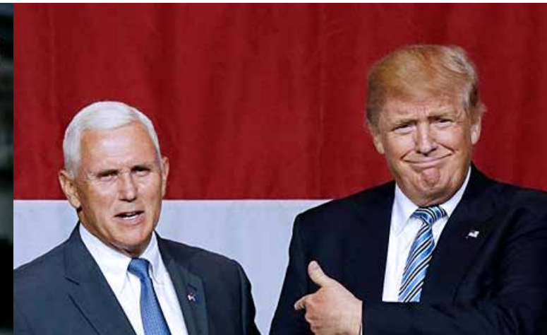
特朗普與副總統人選彭斯

團會議主席，任職衆議院外交事務委員會，2012年當選印第安納州州長。他有豐富的處理共和黨黨內事務與外交、內政和立法的經驗。