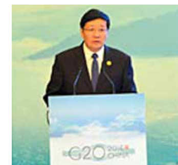
中國財政部部長樓繼偉

中國財政部部長樓繼偉點出了稅收對於協調全球經濟規則以及促進全球經濟復甦的重要性，總結了四項主張來推動國際稅收新秩序：一是要求各國密切關注全球稅收發展動向；二是深化國際稅務合作；三是持續加強稅收能力建設；四是合理運用稅收政策工具。