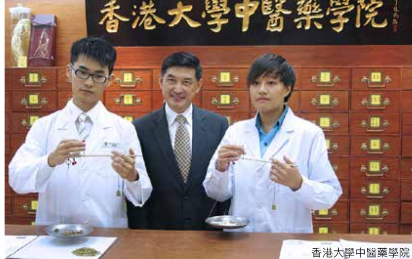
香港大學中醫藥學院