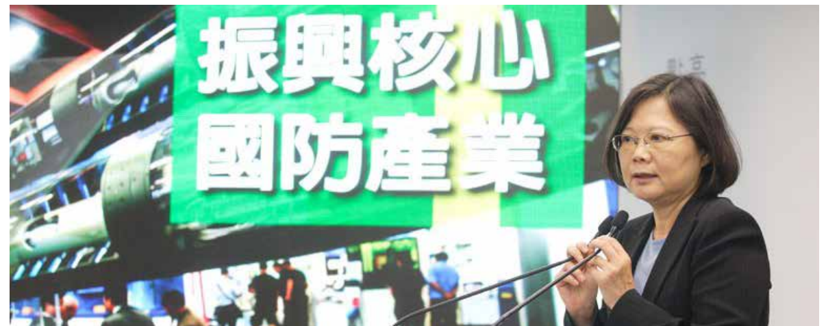
蔡英文在產業創新上提出振興國防

游： 民進黨1986年組黨開始，就講台灣主體的思想，到1991年時把台獨列入了黨綱。後來到1999年，通過了《台灣前途決議文》，讓陳水扁解釋台灣跟中華民國關係，裏面最重要的一個就是說，台灣是一個主權獨立的國家，國號叫中華民國，就這樣讓整個論述更加順暢。2007年，我當黨主席的時候，通過了《正常國家決議文》，雖然台灣現在是主權獨立國家，但不是正常國家，那我們有很多的「不正常」。國際關係不正常、政黨競爭不正常、社會公義不正常，很多東西都不正常，我們慢慢推動國家化，讓它正常。民進黨三十年來的理念蠻一致的，包括台獨黨綱現在還在，並沒有撤掉，雖然