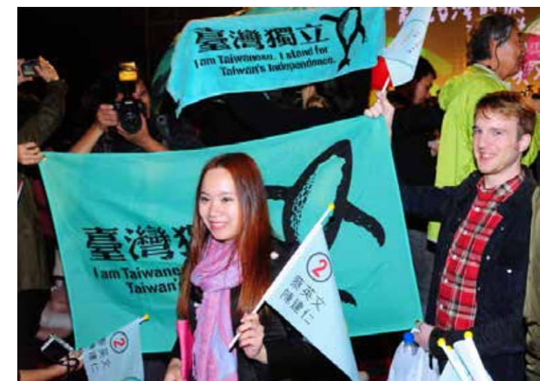
台灣年輕人存在「天然獨」現象

超訊： 這次大選中，應該也看出，老百姓用選票把民進黨再一次推上了執政舞台，高票其實也是民進黨的一個優勢，得到民眾的支持，未來的政策推行可能有它的基礎。你強調了一個主體性，就是說，不管台灣是一種什麼狀態，它本身應該有的價值觀也好、產業的獨特性也好，這個可能要比一個模糊的，大融合的，更有個性，在這次選舉當中是不是也反映出這樣的一個特點？