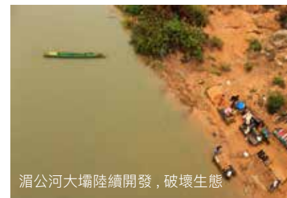
湄公河大壩陸續開發，破壞生態

最近，以中國為主導，與湄公河流域的泰國、柬埔寨、緬甸、越南、老撾等國家合力推動「瀾湄合作機制」，在大湄公河次區域經濟合作和湄公河委員會逐漸失效的情況下，各國開始尋找另一種合作方式。在龐大的經濟利益下，生命、環境和資源成為犧牲品。然而，如果照此以往，最終要付出代價的只能是人類自己。而對於中國來說，今天的中國處於世界強國的地位，可以不管湄公河下游國家的聲音，但這也對中國在處理東盟問題、南海問題、一帶一路和高鐵問題造成潛在的隱患。因此，中國要發揮大國風範，尊重他國，更加透明地處理湄公河問題，才能贏得國際尊重，謀求更高的國際地位和利益。