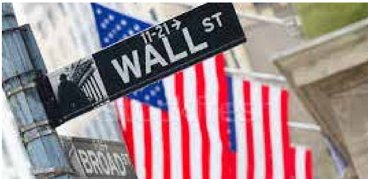
美國 1% 富人控制全國 42% 財富

多人便轉投民主黨的希拉里。接受《超訊》採訪時，柯文·斯密特表示，作為過去二十幾年來一直投支持共和黨的，現在因為「特朗普如果當權的話，是一個非常危險的人物，我是不會投給他的，我會投給希拉里。」過去的兩黨政治，在這一次選舉中消融了。未來兩大黨是否都將因今年的大選而發生巨變，還需要繼續觀察。但是美國草根與精英的分裂，在這次大選中却非常直觀地表現了出來。