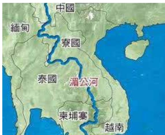
湄公河流經多個國家

湄公河可說是泰國、老撾、越南、柬埔寨和緬甸等東盟五國的「母親河」，為五國經濟發揮重要作用。湄公河水源源頭眾多，包括上游瀾滄江佔 13.5%，越南境內其他水源佔 37%，其餘為泰國及緬甸等國的水源。湄公河亦是全球最大的淡水魚產地，生物多樣性僅次於亞馬遜河流域，養活沿岸五千萬人，也有人在河邊種植水果和淘金，每年經濟