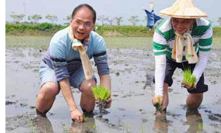
游錫堃在台灣推動有機農業

超訊： 雖然你在上一屆的新北市長選舉只差2萬多票落選，但是你的民望很高，大家希望你出山的呼聲也很大，你對你自己未來對台灣的貢獻，