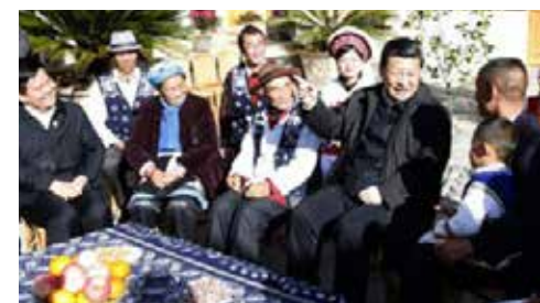
習近平總書記走訪少數民族地區

中國共產黨人對宗教的發展規律不斷探索，在2006年第一次正式提出「宗教和諧論」：「積極引導宗教與社會主義社會相適應，……發揮宗教在促進社會和諧方面的積極作用」。「我們要正確認