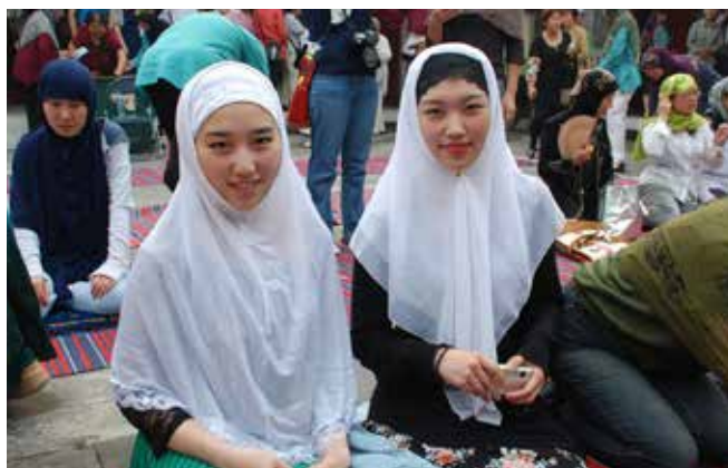
穆斯林在北京參加開齋節活動

發展差距持續擴大。與東部地區相比，民族地區增長速度快，但由於基數小，總量差距還在擴