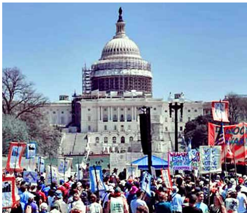
智庫和研究所塑造美國社會走向

爲了爭奪總統大位，特朗普和希拉里正在爲11月的選舉纏鬥。現實政治衝突的背後，有不同的理念和主義在動員大眾。如果將目光從華盛頓白宮周圍移開，會發現散布於美國各地的各類智庫和研究所，在更深層次上塑造著美國政治的走向。