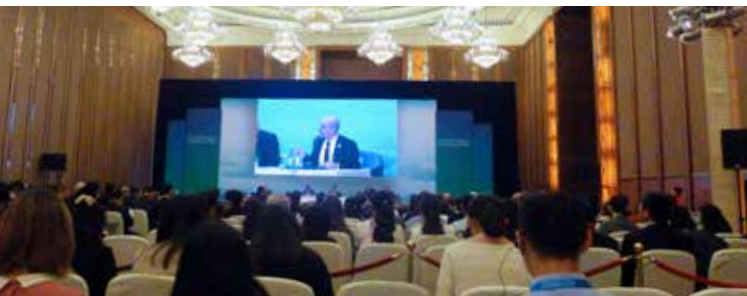
G20 財長和央行行長會議現場