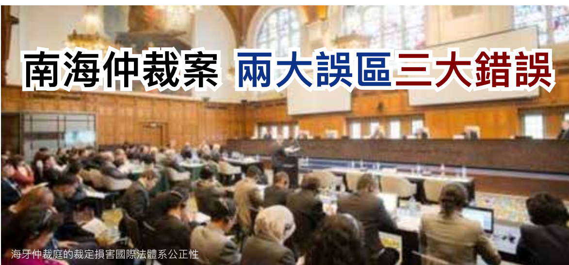
海牙仲裁庭的裁定損害國際法體系公正性

仲裁庭以海洋法制度中的主權權利分割規則去否定國際法體系中的島嶼主權歸屬，根本就是本末倒置的推論方法，難以被國際社會認可，如按這種方式進行海洋區域資源重新分配，不僅是南海，恐怕整個世界都要重新洗牌，結果極可能引發區域衝突甚至世界大戰。