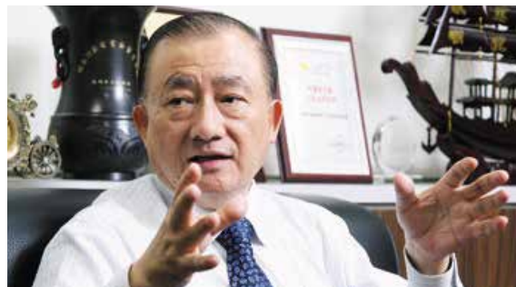
台灣前經濟部長尹啟銘

尹啟銘接受《超訊》記者採訪時說，經濟層面的「南向開拓」過去馬政府八年一直在做，出口