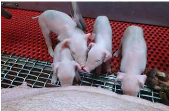
養豬是台灣本土產業之一

游： 民主、自由、人權是普世價值，需要努力去爭取的，它不會從天下掉下來。（資料整理/秦寬）