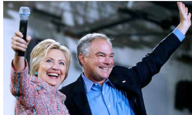
希拉里與副總統人選凱恩

一、行政能力考量：特朗普是華盛頓的局外人。因此，行政能力和政策水平是其最大短板。彭斯曾連任12年國會衆議員，曾出任衆議院共和黨黨